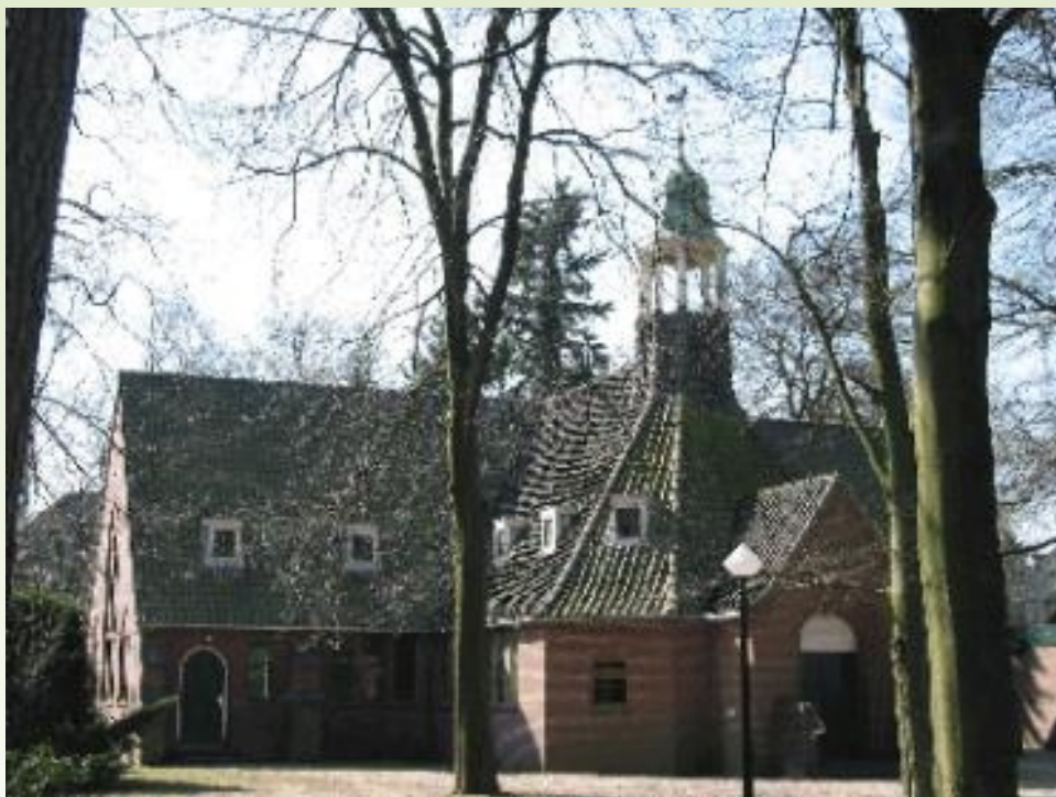
Zuiderkapel Boslaan 1 Bilthoven